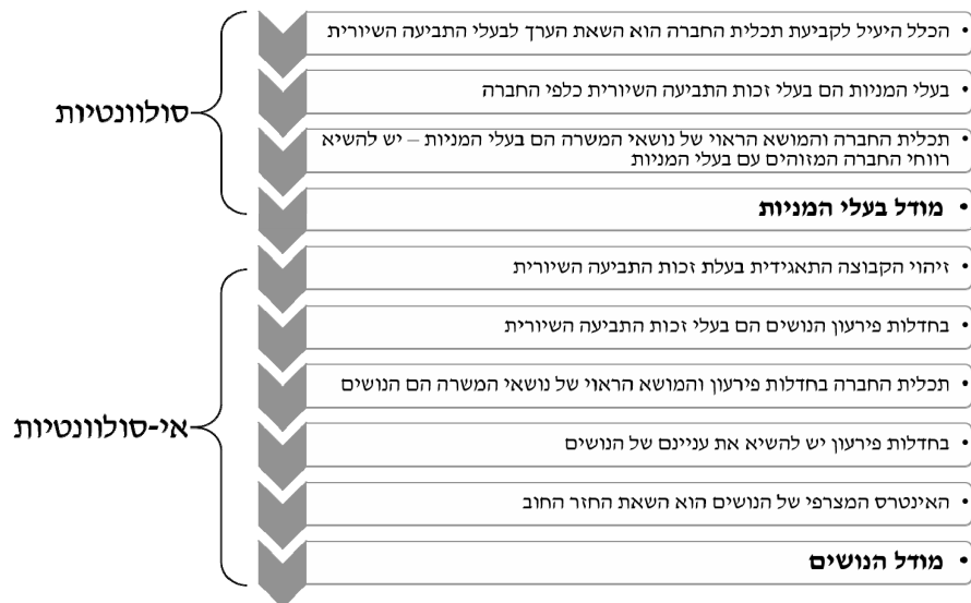
איור 1: המעבר ממודל בעלי המניות למודל הנושים

ניתוח מודל הנושים מעלה כי הוא חשוף לביקורות מגוונות ומהותיות. בתמצית, הביקורות מתרכזות בכך שאין כל ודאות שהנושים הם בעלי זכות התביעה השיורית, שכן ישנו חוסר ודאות אינהרנטי בהגדרה של מצב חדלות פירעון ועומקה של חדלות הפירעון. לפיכך, אין ודאות שהנושים הם בעלי זכות התביעה השיורית ואין ודאות מי מהנושים הוא בעל זכות