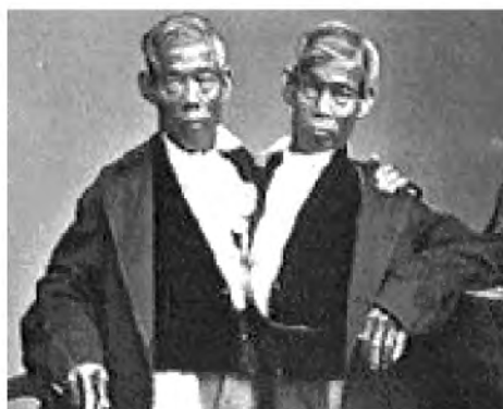
התאומים הסיאמיים, אנג'ושנג 1811 - 1874

בית המשפט לערעורים באנגליה התייחס למקרה באופן דומה ודחה לחלוטין כל הצעה לשלילת ההגנה של המשפט הפלילי מתאומים סיאמיים בטענה שאין הם נחשבים בגדר אדם אלא מפלצת - יצור שאינו בן אנוש. ההנחה שעליה מבוסס פסק הדין בפרשת התאומות הסיאמיות היא שתאומים אלה הם בני אדם לכל דבר, ולפיכך, מי שהורג תאום שכזה, ככוונה לשים קץ לחייו, עובר על איסור הרצח.