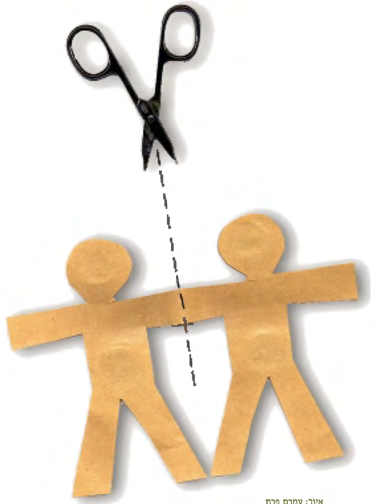
איור: עמרם פרת

יש לציין, שבמסורת היהודית קיימת התייחסות הלכתית ואגדית ענפה לתופעה של ילדים בעלי יותר מראש אחד, ועל אף שיש להבחין בין ילדים אלה ובין תאומים סיאמיים, פרשה ההלכה כי יש להתייחס לשני הראשים כאל שתי ישויות נפרדות 14 .