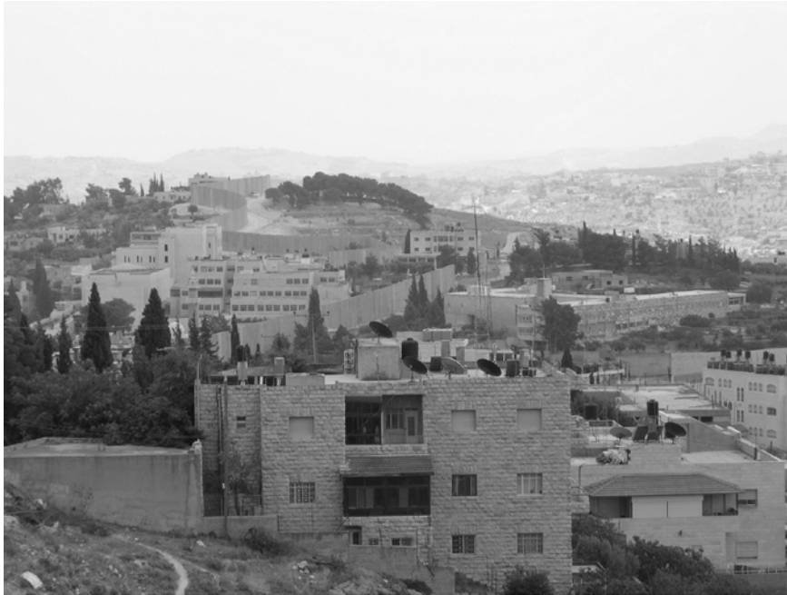
תמונה מס' 1: קטע ממכשול ההפרדה באזור אבו־דיס – חומה.

הגופים השונים מענה לשלוש הבעיות המרכזיות הנוגעות למרחב קו התפר: פעילות חבלנית עוינת, פעילות פלילית ושוהים בלתי חוקיים 20 .