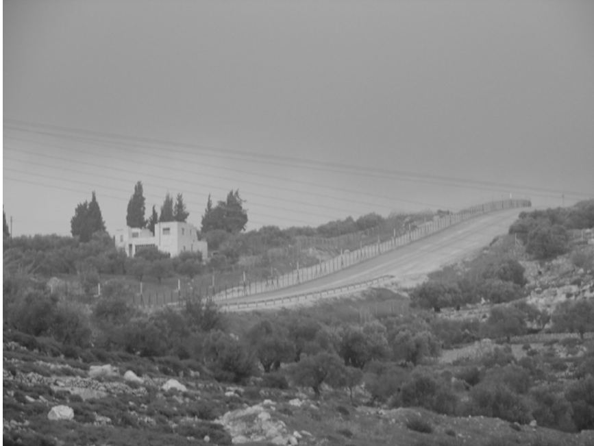
תמונה מס' 2: מכשול קו התפר באזור הכפר ביר-נבאללה – גדרות.